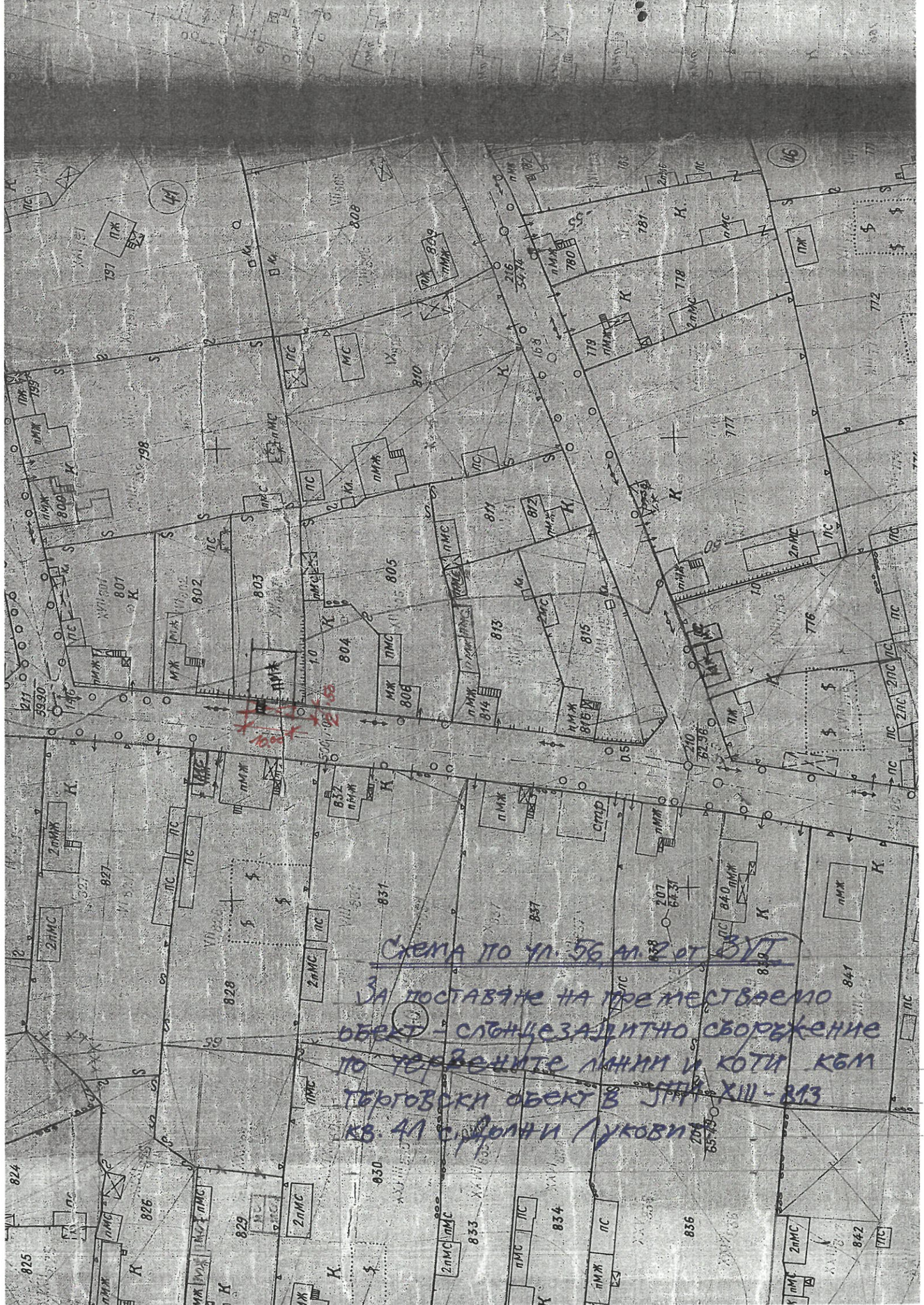
СХЕМА ПО ЧЛ. 56 АЛ. 2 ОТ ЗУТ

ЗА ПОСТАВЯНЕ НА ПРЕМЕСТВАЕМО ОБЕКТ - СЛЪНЦЕЗАЩИТНО СБОРЖЕНИЕ ПО ТОВАЩИТЕ ЛИННИ И КОТИ КЪМ ТЪРГОВСКИ ОБЕКТ В ЗУТ XIII - 813 КВ. АЛ. СУФЛАН И ЛУКОВИ